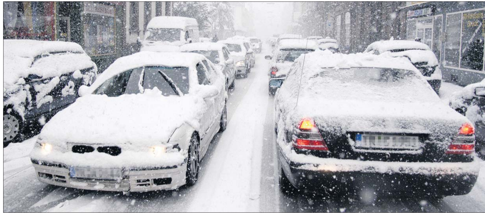
Selbst in Tallagen, wie hier in Trier, machten die heftigen Schneefälle den Autofahrern das Leben schwer.