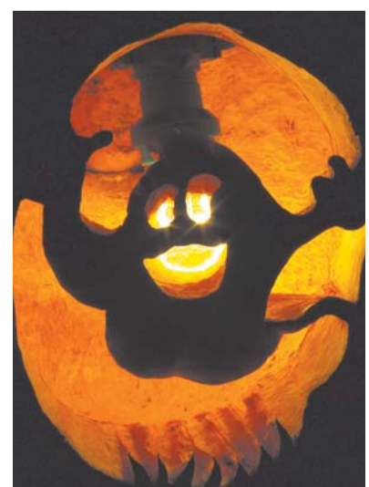
So oder so ähnlich sehen wohl die Geister aus, die in der Region ihr Unwesen treiben.

Den Jäger kennt vor Ort zwar niemand, dafür ist zumindest die Sage der weißen Frau bekannt. Die spukt angeblich, weil sie in ihrem Heimatort Bernkastel-Kues keine Ruhe fand, entlang des Wanderwegs nach Traben-Trarbach...-art/ds