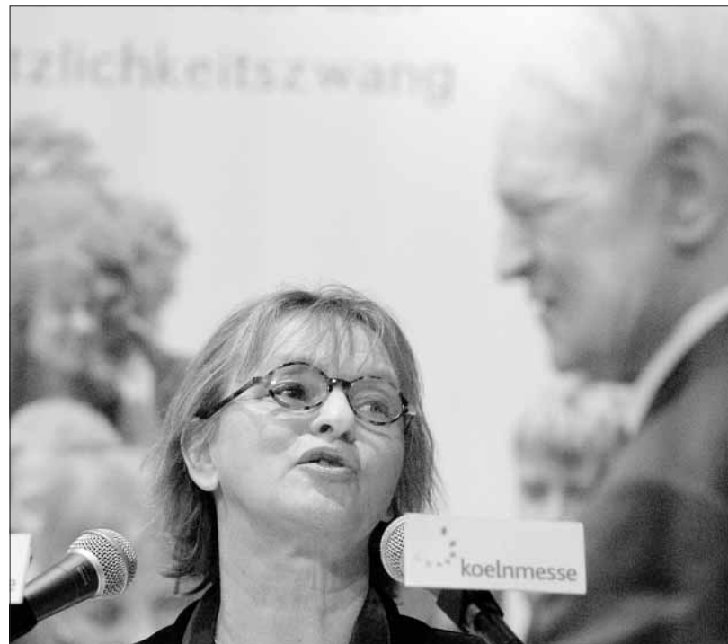
Die Autorin spricht über sein Buch und beide dann zusammen über ein Lieblingsthema: Elke Heidenreich und Bundespräsident Johannes Rau diskutieren über Bildung.

In seinem Buch stellt Rau ein „zukunftsweisendes Projekt“ einer Schule vor: Das Salem International College - eine Privatschule in Überlingen am Bodensee - zu deren Eröffnung er im Jahr 2000 eine Rede hielt. „Überall zeigt sich: Hier werden die Herausforderungen des 21. Jahrhunderts angenommen“, sagte der Bundespräsident damals. Salem bietet dabei all die Dinge, die Rau für Bildung für essenziell hält: Eigenverantwortung und soziales Engagement, Freiräume zum Lernen und Spaß haben, musische und sportliche Ertüchtigung, eine „moderne Ausstattung“ und „zukunfts-gewandte“ Pädagogik. Der - von Rau damals unerwähnte - Knackpunkt: Die Schulgebühren betragen rund 26 000 Euro pro Jahr und Schüler, inklusive Verpflegung und Unterbringung. Diese zentrale Frage in der deutschen Bildungsdebatte lässt Rau in seinem Buch unbeantwortet: Wie viel sollte Bildung die Gesellschaft und den Einzelnen kosten? In Köln betonte Rau ganz allgemein: „Wir müssen mehr in (die Schulen) investieren - an öffentlicher Wertschätzung und auch an finanziellen Werten. Wenn wir für Bildung weiter weniger ausgeben, als wir uns leisten können, dann wird uns das in Zukunft teuer zu stehen kommen.“