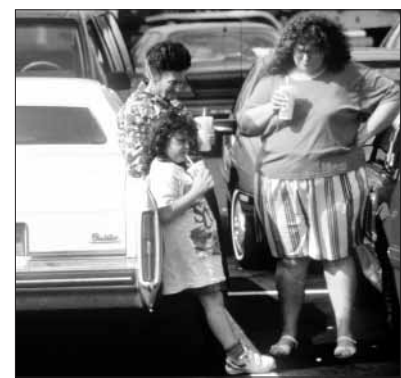
Dicke stehen mit Herzpatienten und Depressiven ganz oben auf der Liste der US-Patientenberater.